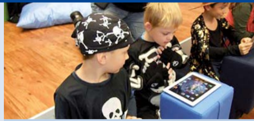
Ušetřili jsme pro děti