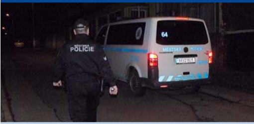
Co se povedlo