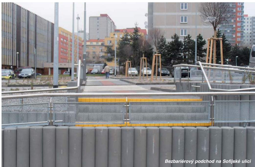
Bezbariérový podchod na Sofijské ulici

byly po pokládce splaškové kanalizace opraveny povrchy dotčených komunikací, přičemž investorem byl Magistrát. Do zdárného konce byl dotažen projekt bezbariérového přechodu přes parkoviště u Prioru směrem k zastávkám MHD v ul. Gen. Šišky, v jehož rámci bylo vystavěno i několik nových parkovacích míst. Kromě uvedených akcí byla na komunikacích ve správě městské části a na všech katastrálních územích zajištěna řada dalších operativních záležitostí jako opravy a doplňování vodorovného a svislého dopravního značení. V oblasti bytového hospodářství proběhly dokončovací přípravné práce a výběr zhotovitele stavby ke kanalizačním přípojkám bytových domů v ulicích Nad Teplárou a Vzpoury. Byly v podstatě dokončeny přípravné práce pro rekonstrukci bývalé družiny v ulici K Dolům. Dokončení na straně 2