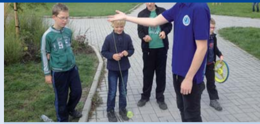
Zázraky s míčkem