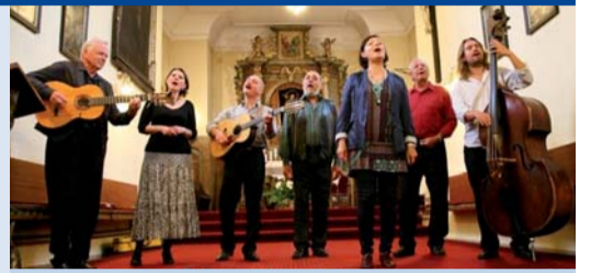
Pozvánka na koncert